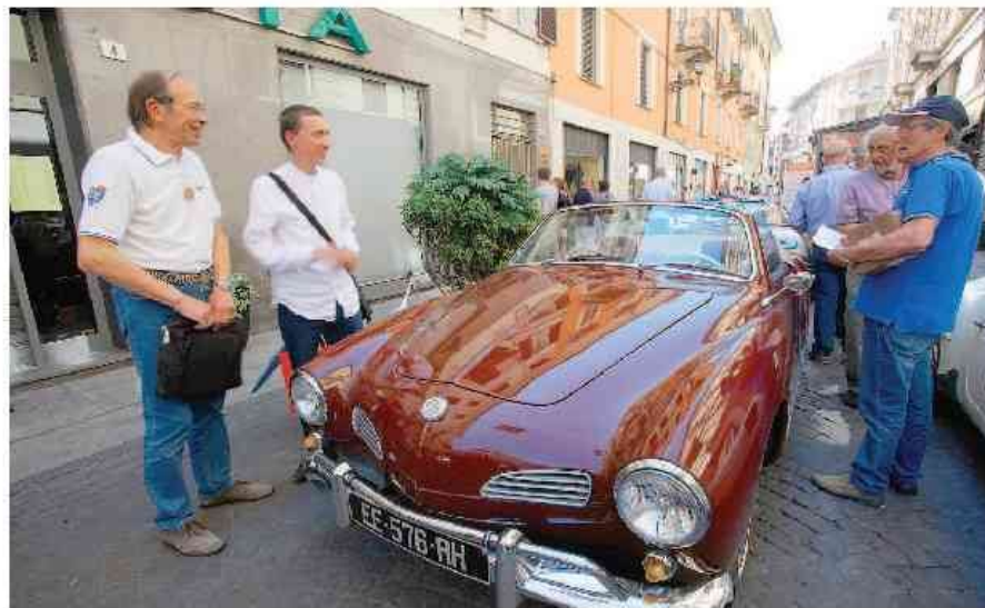
Un momento dell'edizione del 2017 della sfilata delle auto storiche

AUTO STORICHE DA OGGI IN PIAZZETTA DELLA LEGA